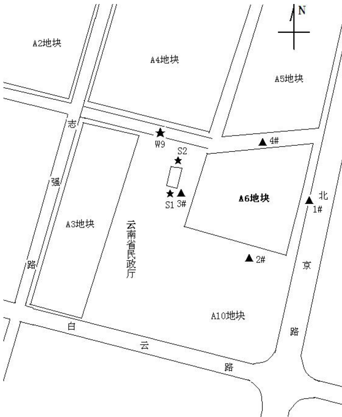
图 5-1 废水、噪声监测布点 (注：★为废水采样点，▲为噪声监测点)