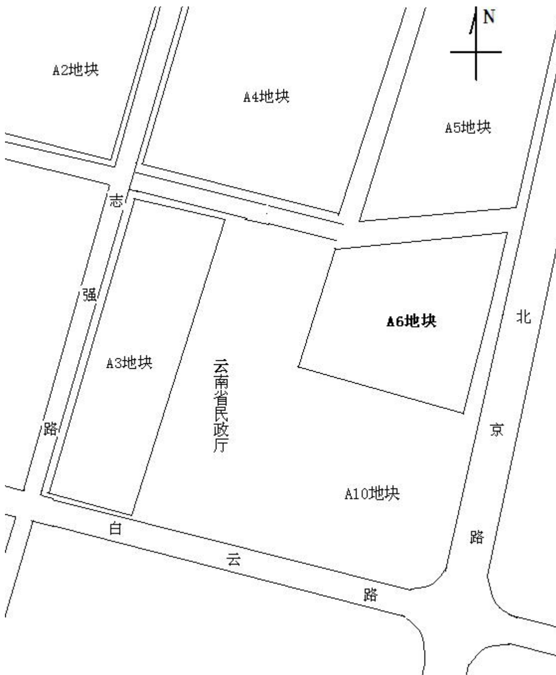
项目周边环境示意图

同德广场 A6 地块项目位于昆明市盘龙区白云路与北京路交叉口。详见附件： 项目周围环境示意图。